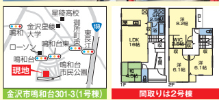
金沢市鳴和台301-3(1号棟)