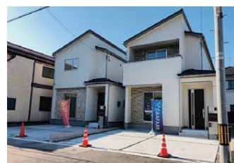
金沢市四十万町北イ43